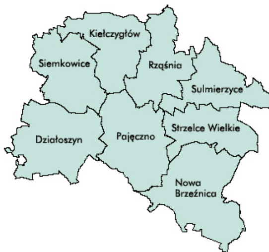
Mapa 1. Powiat pajęczański z podziałem na gminy

Sieć komunikacyjna na terenie gminy jest dobrze rozwinięta. Przez jej teren przebiegają drogi powiatowe wyszczególnione w poniższej tabeli.